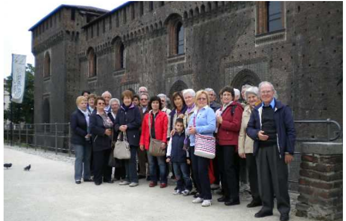
Foto di gruppo dei partecipanti alla gita a Milano

In data 15 maggio 2010 è stata organizzata una gita a Milano con visita del Castello Sforzesco e del Duomo.