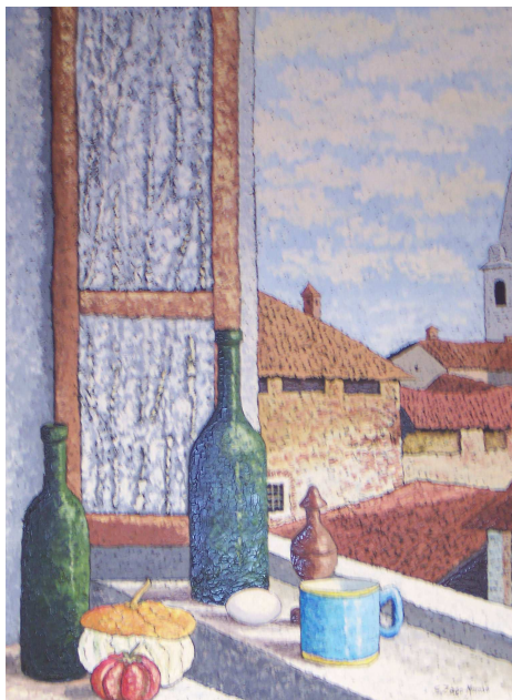
G. Zago Moroso - Il centro storico visto dalla finestra della casa dell'artista.

Come avete notato sono stati ultimamente individuati nuovi parcheggi a tempo. L'intervento è teso ad ottimizzare l'uso dello spazio disponibile, identificando come aree di posteggio libero i due piazzali di via Roma ed utilizzando invece come posteggio a tempo gli spazi davanti agli esercizi pubblici. La decisione è stata motivata dall'aumento del traffico, dall'esiguità degli spazi disponibili e da ragioni di sicurezza.