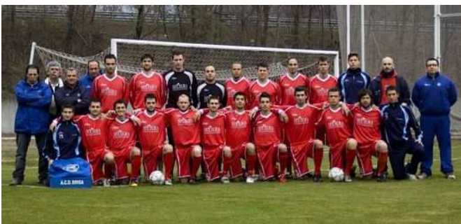
La squadra del Briga Calcio

Domenica 6 giugno il Briga calcio, allenato dal Mister Valsesia, è stato promosso al campionato di Promozione 2010/2011. Grazie alla vittoria del Borgosesia nello spareggio di Play-Out di serie D si sono liberati due posti in promozione uno dei quali è stato aggiudicato dalla nostra squadra. Una conquista ottenuta dopo un campionato in cui il Briga calcio ha sempre mantenuto una posizione ai vertici della classifica. Questo risultato è un motivo di orgoglio per tutta la comunità di Briga.