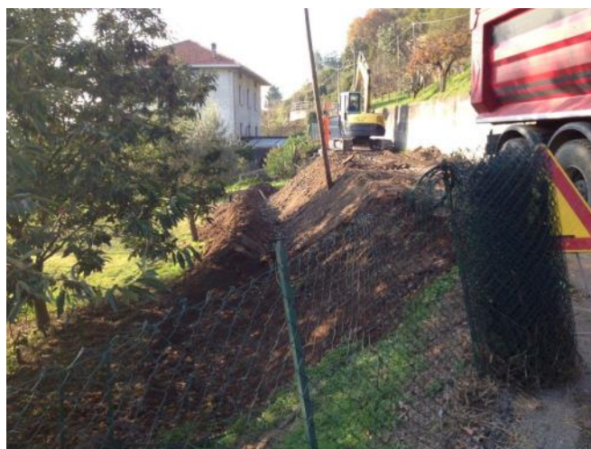
Intervento in Via Rosselli

Intendiamo quindi procedere, in base ai finanziamenti disponibili, a realizzare anche a lotti gli interventi mirati ad implementare le già ottime potenzialità del nostro centro che merita di essere sviluppato e migliorato visto l'indiscutibile successo che ha raccolto tra i brighesi e non.