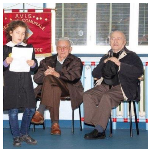
Foto in occasione del IV novembre con gli alunni delle scuole