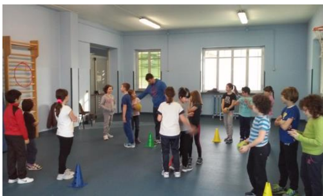
Attività di motoria con l'esperto

Infine si ricorda la festa d'Istituto, il cui svolgimento è fissato per il 23 maggio nell'area esterna dell'Oratorio di Gozzano (in caso di maltempo nei locali delle scuole). Qui la Scuola primaria sarà presente con alcuni stand: origami, piantine aromatiche in vasetto coltivate dai bambini, laboratorio creativo con alimenti (cibo regionale, europeo, mondiale), produzione artigianale di dolci tipici.