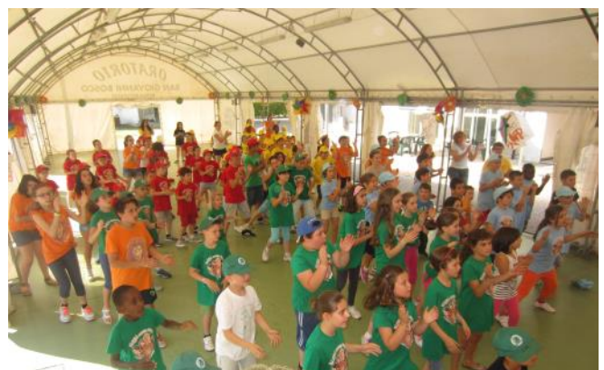
Il gruppo dell'Oratorio

Con la celebrazione della S. Messa delle ore 11.00 di domenica 14 giugno, inizierà ufficialmente il GREST 2015 che da lunedì 15 giugno, per tre settimane (escluso il sabato e la domenica), dalle 7.30 sino alle 18.00, accoglierà i nostri bambini e ragazzi nell'attività più impegnativa e significativa che l'Oratorio propone. A breve verranno diffuse informazioni più dettagliate. Come negli anni passati, la realizzazione del GREST è vincolata dalla presenza dei tanti volontari che decideranno di regalare una parte del proprio tempo a favore di questo importante servizio educativo.