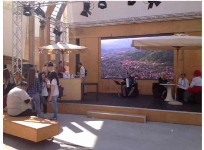
Briga Novarese ad Expo 2015

Un grande e vigoroso grazie va di sicuro alla nuova Amministrazione Comunale che non ha solo consolidato i legami già saldi tra la Pro loco e l'amministrazione precedente, ma ha anche creato un clima collaborativo e di scambio di idee su iniziative in corso e altre programmate nel corso dell'anno. Tutto ciò non può che sfociare in un grande beneficio per la collettività e per lo spirito di aggregazione che tiene vivo un paese come il nostro.