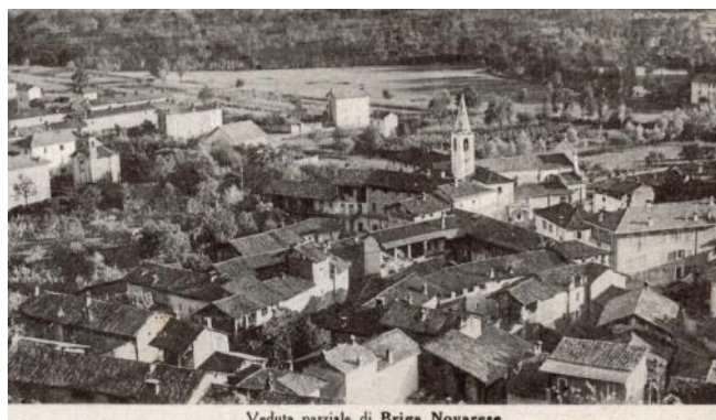
Anni 40—Panorama di Briga Novarese